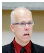
Goran LINDBLAD europarlamentar suedez

Motto: „Crescând în Suedia, atât de aproape de Imperiul Sovietic, am fost întotdeauna împotriva comunismului... aceasta a fost prima dată când un grup internațional de parlamentari a condamnat comunismul... Toate partidele comuniste occidentale au fost sponsorizate de Soviete, dar și de RDG” – Goran Lindblad